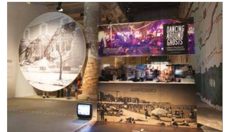
Italian Pavilion at Corderie dell'Arsenale. "Dancing Around Ghosts" installation at the 14 th International Architecture Exhibition.