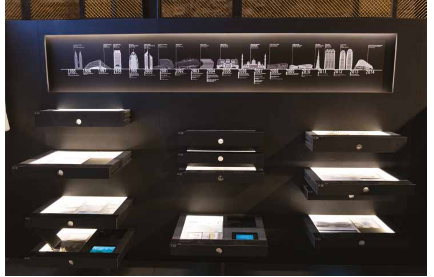
UAE National Pavilion Installation - "Lest We Forget: Structures of Memory in the UAE".

This is a exhibition very much in the spirit of Koolhaas's own thinking - that so far as buildings are concerned, human beings come first, context is vital and architecture should be their servant, not master. And because of the way that it has been born out of the lives and collaboration of the community, it will surely have a long life after the Biennale closes on 23 November this year. □