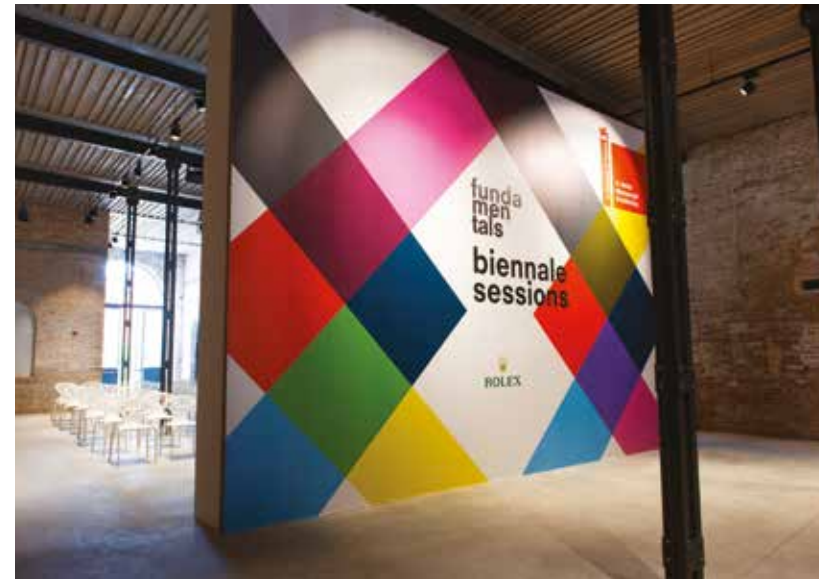
2014 Biennale Architecture exhibition 'fundamentals' lecture venue.

But first, an explanation of how the Venice Biennale works. The board appoints a curator, in recent years nearly always a non-Italian architect or architectural commentator of great distinction. He (there have been no women yet) is responsible for choosing a theme, and