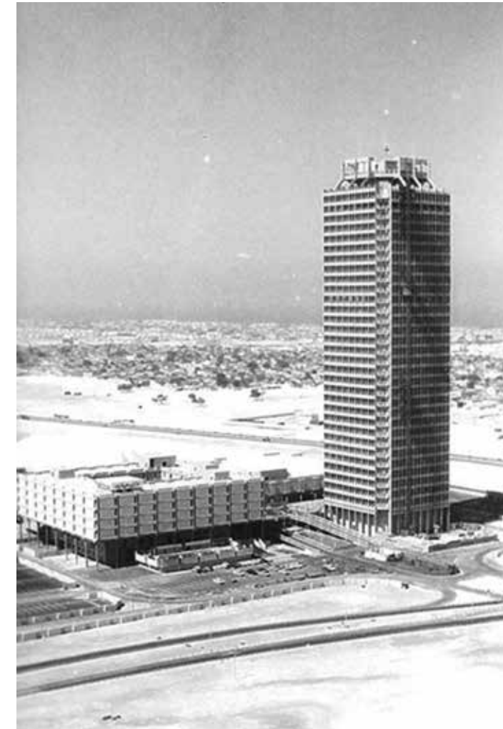
Dubai World Trade Center, opened 1979. part of the "Lest We Forget: Structures of Memory in the UAE" installation.