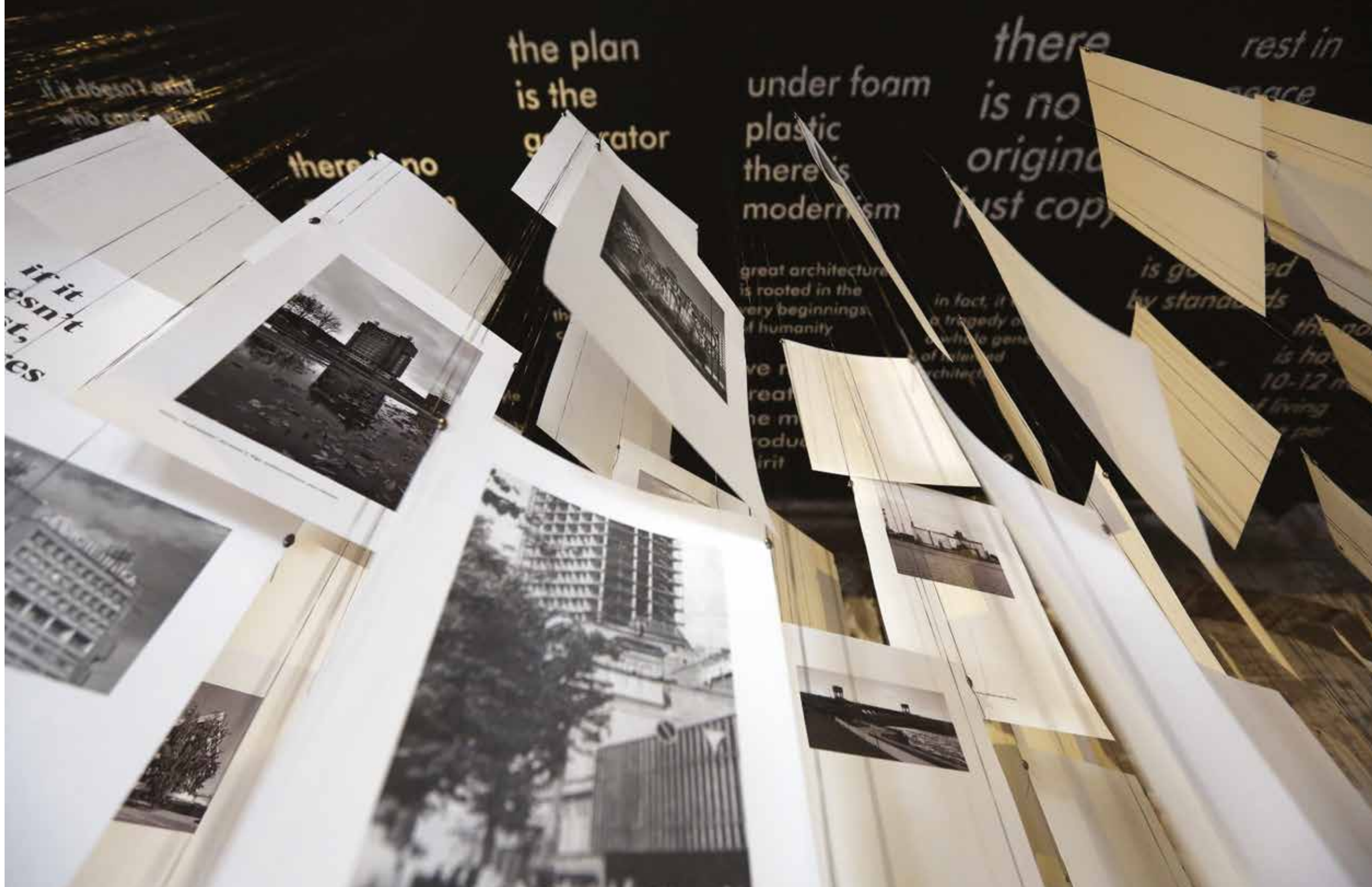
General view of Latvia Pavilion at Corderie dell'Arsenale during the opening of The 14 th International Architecture Exhibition.

It includes yellowing snapshots, digital photos, blueprints, contracts, all the kinds of things that tend to get lost just before people realise they will miss them. She says that she realised the country was in danger of losing an important layer of history because, not only were the traditional buildings