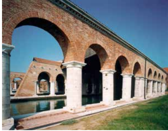
The Gaggiandre venue at the 14 th International Architecture Exhibition.

وقد طلب ريم من كل جناح وطني في البينالي أن يُظهر كل على طريقته، عملية محو الخصائص الوطنية في فن العمارة لصالح اعتماد عالمي للغة حداثة وأنماط موحدة، وهي في الواقع عملية أكثر تعقيداً مما نتصور.