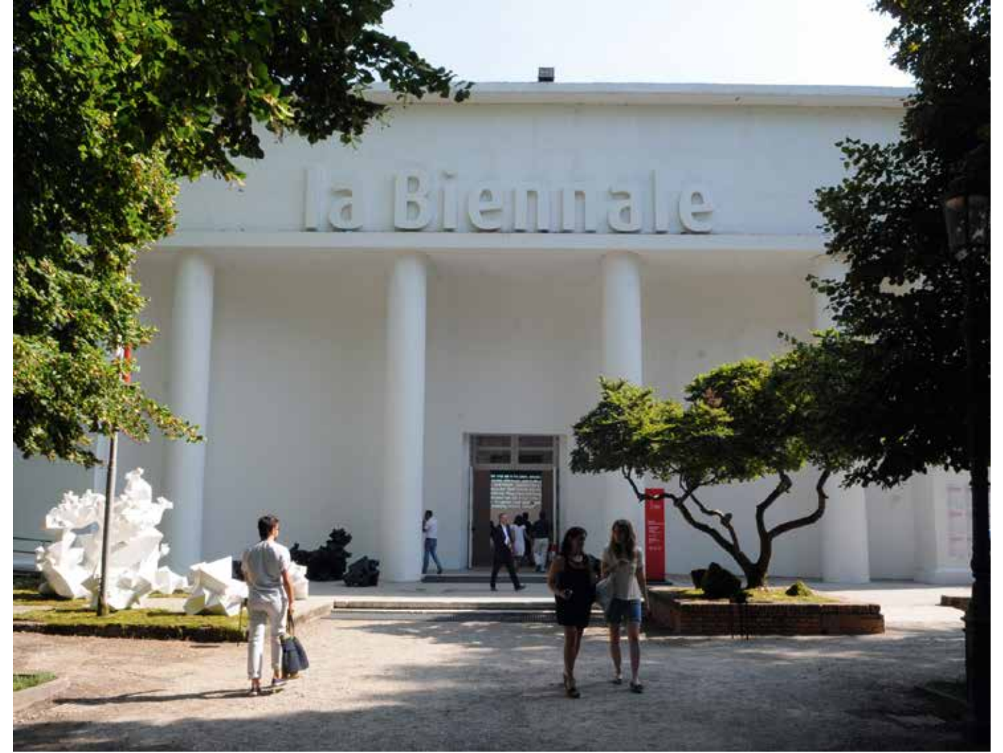
Padiglione Centrale venue at the exhibition.

عُقد مؤخراً في قصر الحصن، أحد أقدم المباني التاريخية في مدينة أبوظبي، معرض يحظى باهتمام العائلات الإماراتية، إذ يضمّ صوراً خاصة التقطها مواطنو الدولة، تختصر قصص حياتهم بعد توحيد البلاد، ومن المقرر أن يتوج المعرض بإصدار كتاب خاص خلال الخريف المقبل. وشاءت الصدفة أن يبدأ هذا المشروع على نطاق ضيق مع طالبات وخريجات كلية الفنون والصناعات الإبداعية في جامعة زايد بأبوظبي، وتحت إشراف الدكتورة ميشيل بامبلينغ، ليتوسّع فيما بعد مع الظهور لأول دولة الإمارات العربية المتحدة في معرض العمارة الدولي بدورته الرابعة عشر في بينالي فينيسيا.