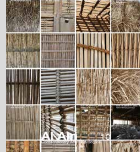
Arish - Palm leaf architecture.

والاحتياجات الجديدة، إذ إن سعف النخيل من الموارد القليلة المتجددة في شبه الجزيرة العربية، التي يمكن أن تعود بذاكرة الفرد إلى محطات عدّة، بغية إعادة خلق الذكريات نفسها باستمرار ثقافية أصيلة وهوية إقليمية.