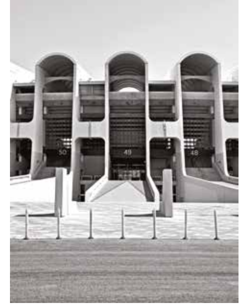
Zayed Sports Stadium, 2014 part of the "Lest We Forget: Structures of Memory in the UAE" installation.

one of her classes at University by one of the grand-daughter's of the late Sheikh Zayed himself. It was the record of a visit he made to Africa, with photos of him holding up babies and talking to dignitaries. Dr Bambling had been encouraging her students to bring in family photos so as to reconstruct and share the early history of the UAE as a country, and the initial reluctance of families to allow this was overcome when the album of Sheikh Zayed was shown around.