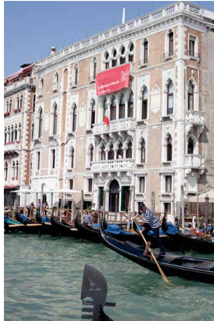
Ca' Giustinian venue external view.

Koolhaas has direct experience of being in more than one culture, of seeing the world from more than one viewpoint, because as a child he lived in Djakarta. Years later, his