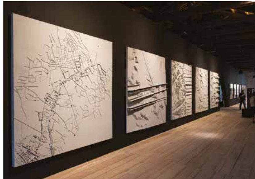
Turkey Pavilion installation at Corderie dell'Arsenale.

ولن نتفاجأ كثيراً إن تضمّن المعرض بعض الفنون