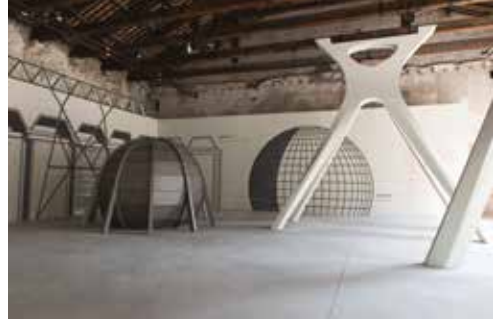
Kuwait 's Pavilion 'Acquiring Modernity', at the Biennale.

«لكل مبنى حياتان اثنتان على الأقل؛ الأولى هي تلك التي يتصورها بها صانعها، والأخرى التي تبقى حية بها بعد ذلك، ولا يمكن أن تكون هاتان الحياتان متشابهتين أبداً.»