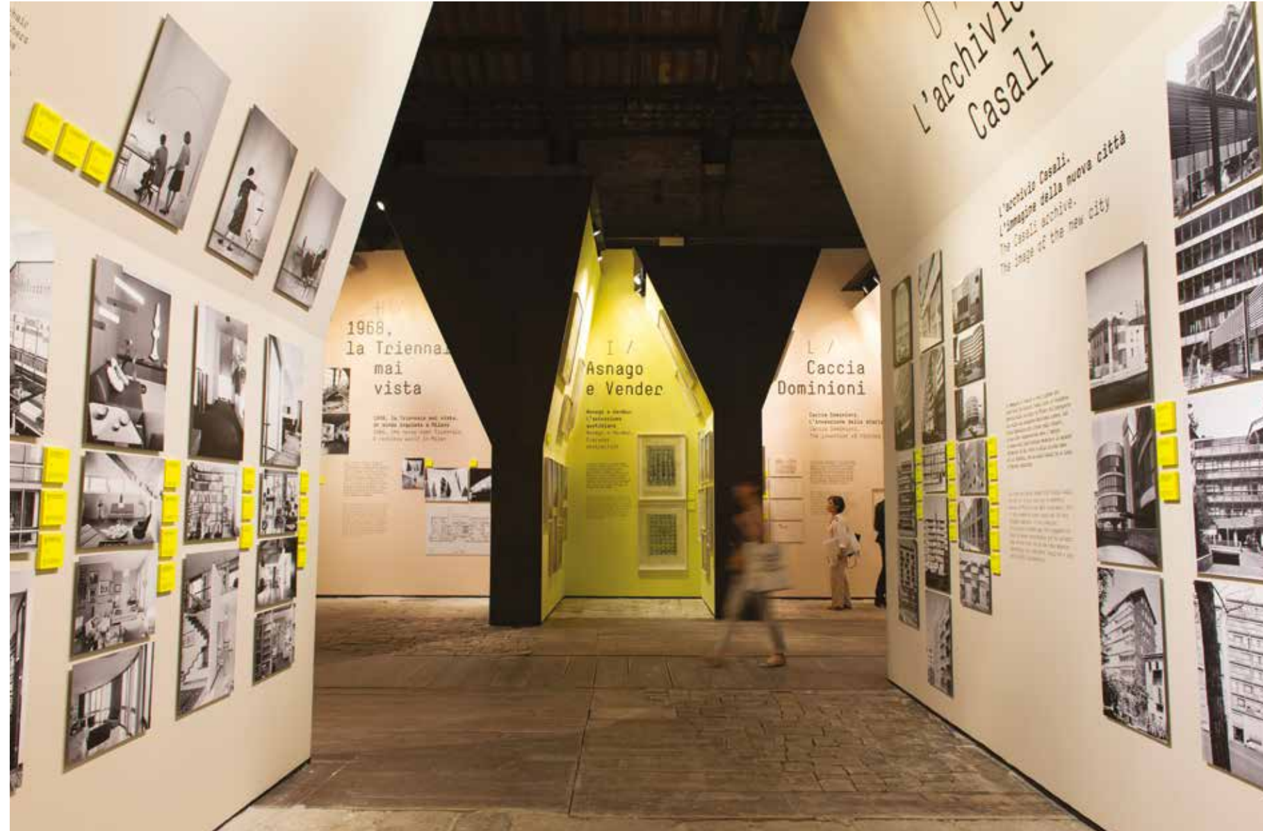
Italian Pavilion at Corderie dell'Arsenale.

أما الجانب الثالث من البينالي فيكتم فيه المعماري الهولندي ضيوفه الإيطاليين، تحت اسم «العالم الإيطالي» (Monditalia)، حيث يعرض إرث إيطاليا وتاريخها في الأرسينال بمساعدة متعاونين محليين، فضلاً عن خارطة تاريخية على امتداد هذه المساحة الكبيرة (دار الصناعة)، كما يتخلل المعرض أفلاماً ورقصاً وموسيقى ومسرحاً بين المنشآت المعمارية.