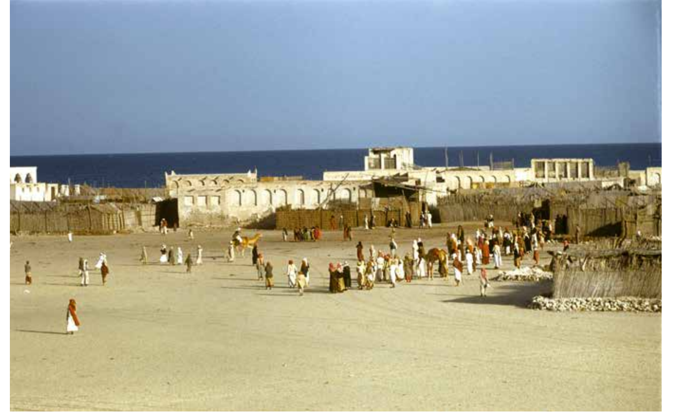
Finish of a camel race, Dubai, 1950. part of the "Lest We Forget: Structures of Memory in the UAE" installation.

وبالتالي، ما بدأ منذ سبع سنوات كمشروع صغير ضمن صف أكاديمي، تطوّر ليُصبح أرشيفاً عبر تاريخ مرئي ومقابلات ونقاشات مُصورة لـ 58 عائلة تشاركت في عرض صورها. ومنذ أكتوبر الماضي، عندما تمّ تعيين مامبلينغ للإشراف على الجناح الوطني، بدأت تتكوّن نواة «سجل الآثار الوطنية»، وهو عبارة عن أرشيف مرئي للبلاد. وقد صرّحت بأنه صحيح أنها لا معمارية ولا مؤرخة معمارية (هي خبيرة في اليابان)، إلا أن عملها الذي يُعنى بطرق عيش الإنسان جعلها تهتمّ بطبيعة الحال بالمباني التي يسكن فيها الناس.