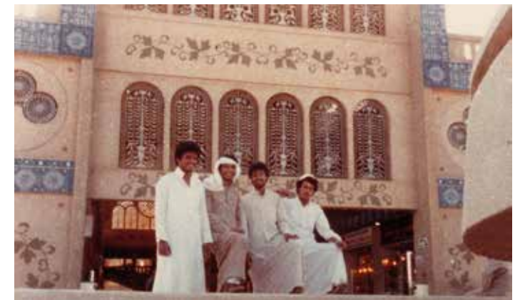
Cultural Foundation and National Library, opened 1981, TAC The Architects Collaborative formed by Walter Gropius part of the "Lest We Forget: Structures of Memory in the UAE" installation. Blue Souk Visit, 1984 part of the "Lest We Forget: Structures of Memory in the UAE" installation.